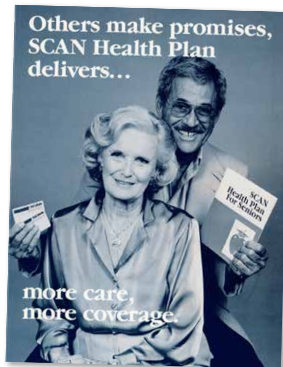
Primer anuncio impreso

En la actualidad, SCAN Health Plan cuenta con 186,000 miembros, y trabajamos con miles de personas mayores y cuidadores a través de nuestros programas comunitarios. Sin embargo, nuestro compromiso es el mismo que el que teníamos hace 40 años: mantenerlo sano e independiente.